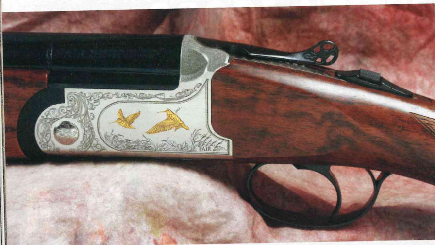
Sui due fianchi di bascula, oltre alle volute vegetali realizzate a laser, sono raffigurate due beccacce in volo, in pose differenti, dorate elettroliticamente

Per ottenere un fucile superleggero, ideale per la caccia vagante nel bosco, Fair non poteva fare altro se non scegliere di partire da una bascula in lega leggera. La bascula del Classic De luxe Beccaccia, in particolare, è ottenuta da un massello di Ergal 55 di grado aeronautico, fresata e finita per nichelatura. La bascula è dimensionata per il calibro e misura 58 millimetri di altezza e 36 millimetri di larghezza. Il profilo della cartella è evidenziato da un solco inciso, mentre le conchiglie sono smussate e caratterizzate da una texture a buccia d'arancia. L'intera bascula è decorata da una gradevole incisione a volute vegetali, di gusto rinascimentale, eseguite a laser con triplice profondità. L'incisione, inoltre, è impreziosita da soggetti venatori, incisi a laser e dorati elettroliticamente. Su entrambi i fianchi di bascula sono raffigurate due beccacce in volo, in pose differenti, mentre sul petto di bascula è ritratta un'altra beccaccia, immortalata nel momento del frullo e circondata da un intrico di rami e foglie. Sul petto, come di consueto, ci sono anche il nome del modello e il logo del produttore. Il ponticello è realizzato in acciaio, lavorato dal pieno e brunito nero, così come la chiave di apertura, che presenta anche ▶