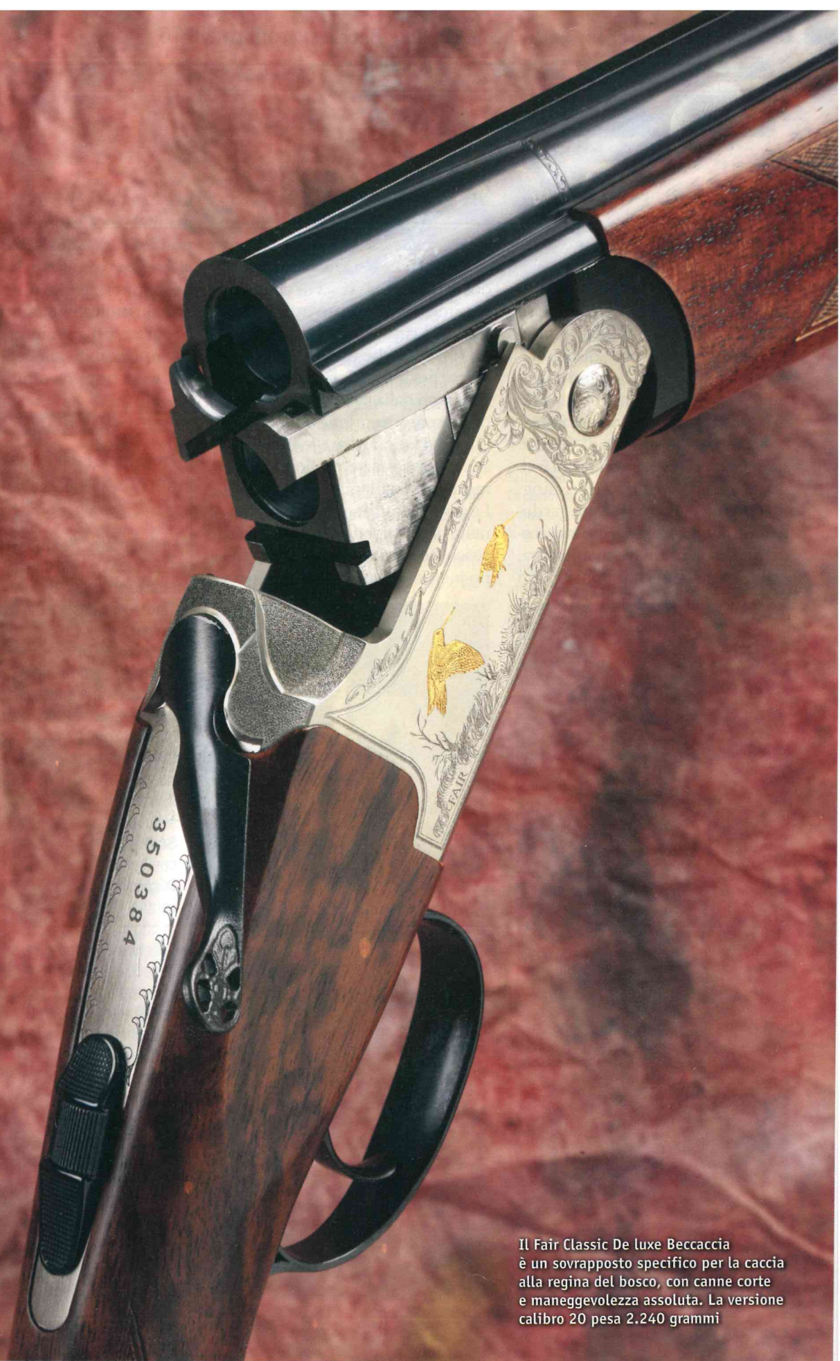
Il Fair Classic De luxe Beccaccia è un sovrapposto specifico per la caccia alla regina del bosco, con canne corte e maneggevolezza assoluta. La versione calibro 20 pesa 2.240 grammi