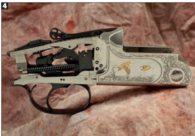
1. Sul petto di bascula, oltre al nome del modello e al logo del produttore, è raffigurata una beccaccia in frullo, circondata da un intrico di rami e foglie. 2. Sulla coda di bascula è collocata la classica sicura manuale a cursore, a due posizioni, che ospita anche il selettore della prima canna. 3. Sulla faccia di bascula è presente una piastra in titanio per irrobustire la zona dei percussori e per scongiurare la possibile corrosione causata dagli inneschi delle cartucce. I puntoni di armamento sono sdoppiati e scorrono al centro del fondo di bascula. 4. La batteria è fissa, tipo Anson & Deeley, nella coda di bascula. Le molle sono a spirale, i cani hanno un doppio dente di sicurezza e lo scatto inerziale è fornito di un monogrillo selettivo.

a tutto vantaggio di rosate più uniformi. Si riduce considerevolmente anche il picco di pressione, con un rinculo meno punitivo e più progressivo, caratteristica particolarmente apprezzabile soprattutto su un sovrapposto che fa della leggerezza estrema un suo tratto distintivo. Nel caso dell'esemplare in prova, le canne hanno fatto segnare sulla nostra bilancia digitale un peso di 1.070 grammi, compresi i due strozzatori montati. Il fucile, infatti, è fornito di serie con un set di tre strozzatori interni intercambiabili Technichoke hunting Xp50, lunghi 50 millimetri, con valore di strozzatura di ***** cilindrico, **** Improved cylinder e *** Modified. Trattandosi di tre strozzatori con costrizione non superiore a quella intermedia, sono tutti compatibili anche con l'impiego di munizioni caricate con pallini in acciaio.