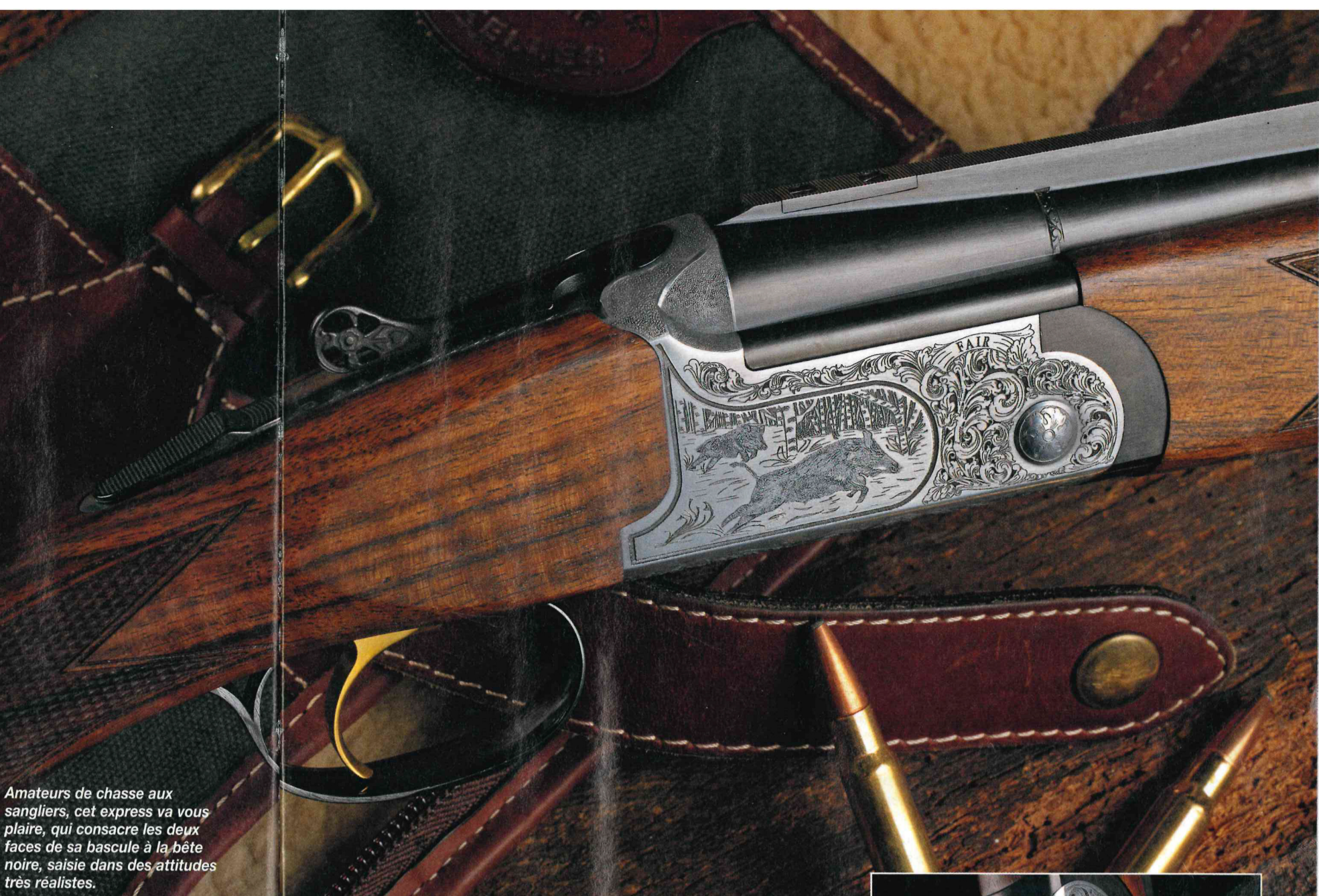
Amateurs de chasse aux sangliers, cet express va vous plaire, qui consacre les deux faces de sa bascule à la bête noire, saisie dans des attitudes très réalistes.

des chasseurs, même les plus grands. Le devant, qui se dépose au moyen d'un auget noir, est lui aussi relativement long, avec 24,5 cm. Ces dimensions généreuses ne laissent « dépasser » que 24,5 cm de canons, ce qui concourt à une impression d'arme courte, compacte même.