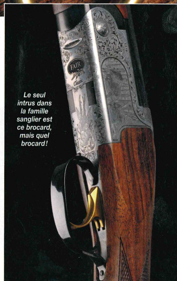
Le seul intrus dans la famille sanglier est ce brocard, mais quel brocard!