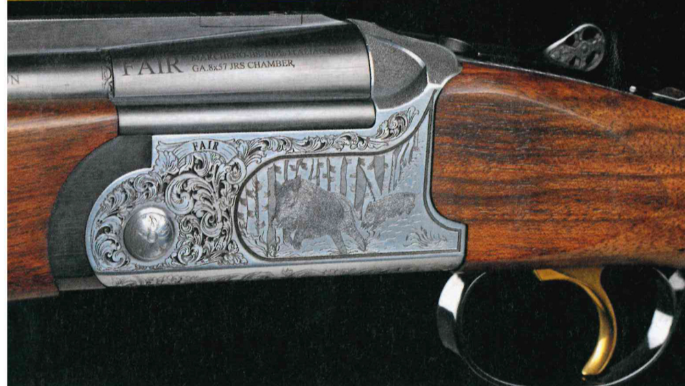
La face gauche de la bascule, avec un sanglier en pleine course qui s'apprête à sortir du fusil.

dée de deux inserts de fibre optique verte. Le tout est monté sur queue d'aronde là encore. Le guidon est fixé sur une rampe et se résume à une fibre optique cylindrique rouge dont la hauteur est réglable via une vis et un ressort sous tension. Les canons sont assemblés de manière traditionnelle avec une frette monobloc en acier 39NCD4Ph et des bandes pleines (à l'exception d'un trou à la sortie des chambres) en acier. La frette est soudée à l'argent, les bandes à l'étain. Une fine bande pleine couvre le sommet du canon supérieur. Aucun système de réglage de la convergence n'est prévu, elle est réglée en usine au moyen d'une cale biseautée, les tubes sont soudés et la cale arasée. Ce dispositif a l'avantage d'avoir toute confiance dans le fabricant puisque la convergence des deux tubes ne pourra plus être modifiée. Fair a amplement prouvé son savoir-faire en la matière. Bien sûr, cela implique de ne pas vous tromper sur