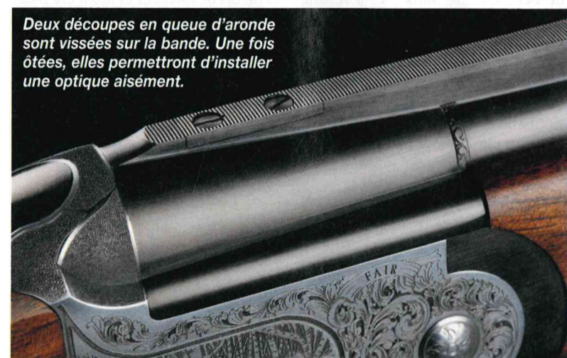
Deux découpes en queue d'aronde sont vissées sur la bande. Une fois ôtées, elles permettent d'installer une optique aisément.